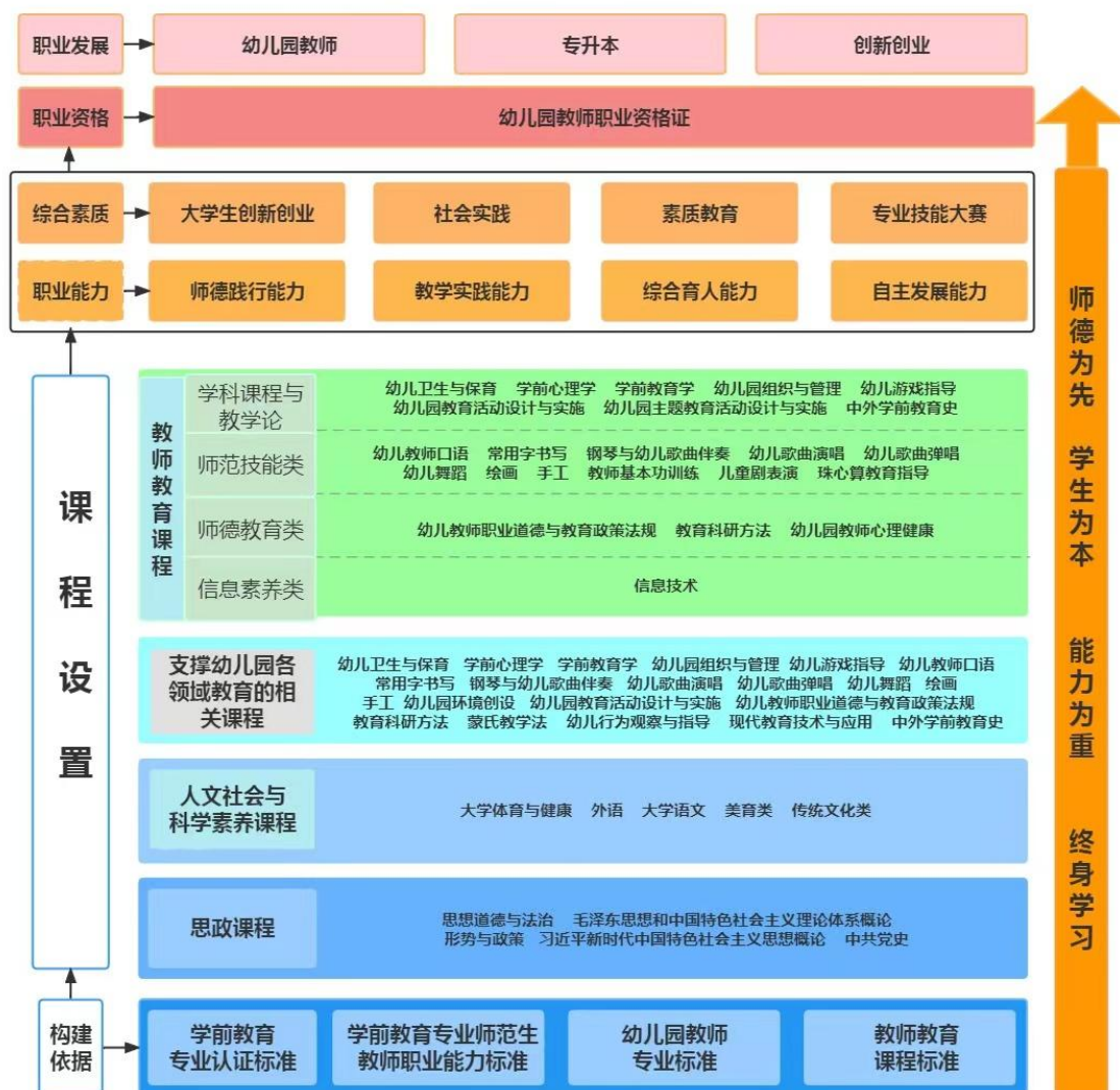
图2 学前教育专业课程体系构建图

教师教育课程，培养学生的保教能力、班级管理能力、教育科研能力；通过社会实践、社团活动、专业技能大赛、科技竞技比赛等提升学生的综合素质。“课岗证融合”培养学生师德践行、教学实践、综合育人、自主发展的职业能力。